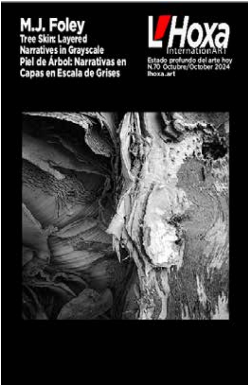
Cover N.70 October 2024

Graphic Design LFQ Follow us on the web archive: lhoxa.art All rights reserved